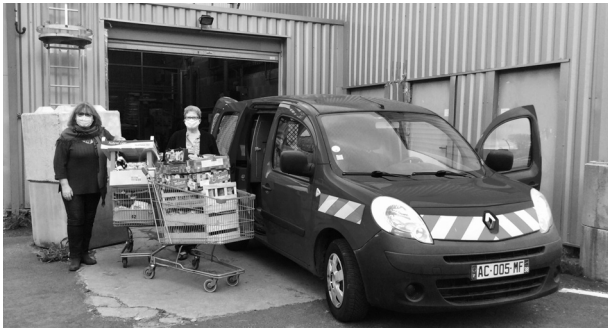
Les bénévoles des Restos du Cœur lors de leur ramasse avec leur Kangoo

L'antenne des Restos du Cœur de Ydes qui approvisionne le point accueil de Riom-ès-Montagnes effectue désormais ses "ramasses", (collectes de produits frais auprès de magasins associés dont la date de consommation arrive à échéance, mais toujours consommables en toute sécurité), à bord d'un véhicule offert en septembre dernier par la société Enedis.