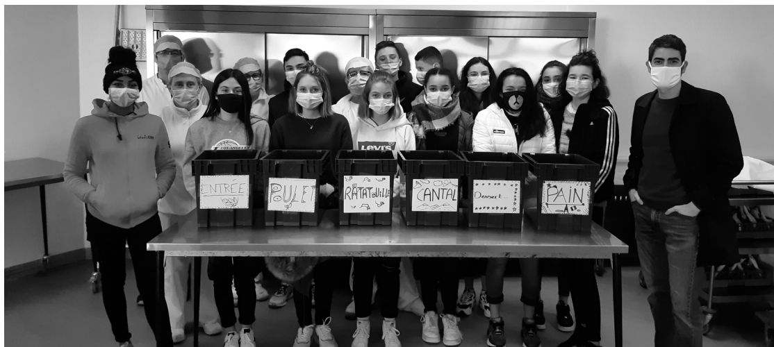
Les élèves de 4ème A lors des premiers relevés sur les quantités servies à la cantine du collège Georges Bataille

Depuis le début du mois de janvier, le collège Georges Bataille mène un projet axé sur la lutte contre le gaspillage alimentaire.