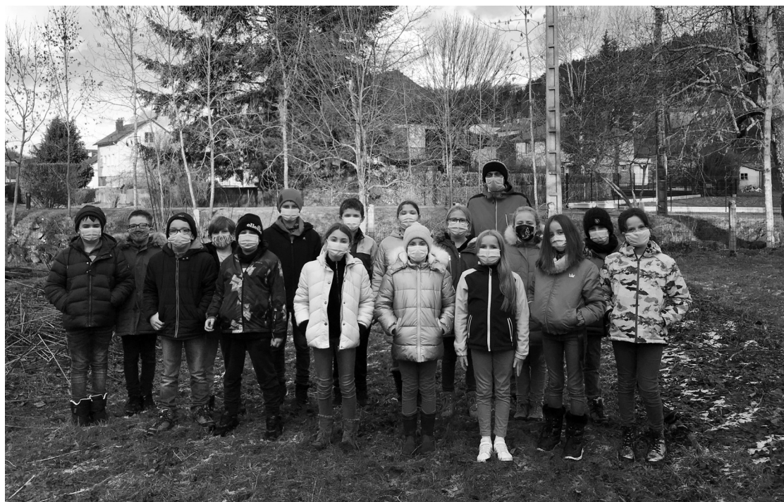
La classe de CM2 dans le potager de l'école

laire. C'est ainsi que l'école et la mairie ont été contactées et que les élèves de CM2 ont bénéficié de trois interventions sur le thème de l'alimentation durable et en circuit court.