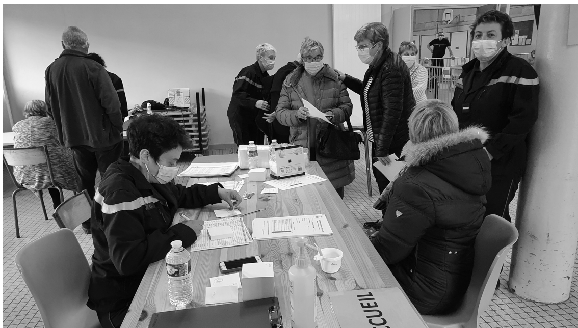
Dès l'entrée les candidats au vaccin étaient accueillis par les sapeurs-pompiers riomois

Initiée par la municipalité, en lien avec les services de Monsieur le Préfet et le conseil de l'ordre des médecins du Cantal une journée de vaccination contre la Covid-19 était organisée au gymnase municipal de Riom-ès-Montagnes le 16 avril dernier. 208 personnes ont pu y recevoir leur première injection du vaccin Pfizer.