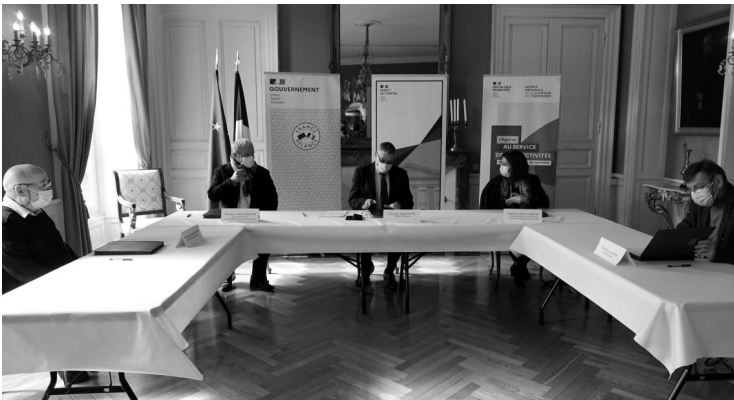
Signature de la convention "Petites Villes de Demain", à la Préfecture du Cantal à Aurillac

Le programme "Petites Villes de Demain" constitue un outil de la relance au service des territoires. Il ambitionne de répondre à l'émergence des nouvelles problématiques sociales, économiques et