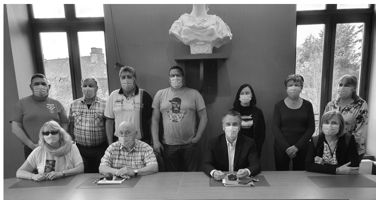
Accueilli en Mairie, le sénateur Bernard Delcros a échangé avec les élus riomois