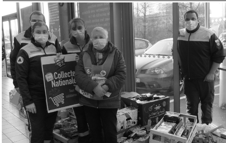
Les bénévoles en place dans un supermarché pour la collecte des restos du Cœur

Les actions qui gravitent autour des Restos du Cœur sont nombreuses.