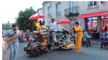
Concert "la Locomobile" avenue de la Gare

Les jeudis de l'OMAF revenaient cet été pour une neuvième édition bien remplie et 6 soirées gratuites programmées en centre-ville. L'Office Municipal des Animations et des Fêtes (OMAF) tenait à poursuivre la diversification de sa programmation tous publics en proposant quatre concerts, une pièce de théâtre et un spectacle de jonglerie.