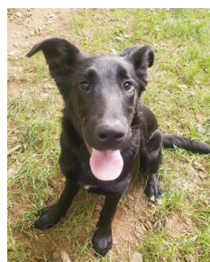
Sia, chiot femelle à l'adoption

Refuge Bienvenue, Route de Menet, Les Baissaires 15400 Riom-ès-Montagnes Tel : 04 71 78 09 80