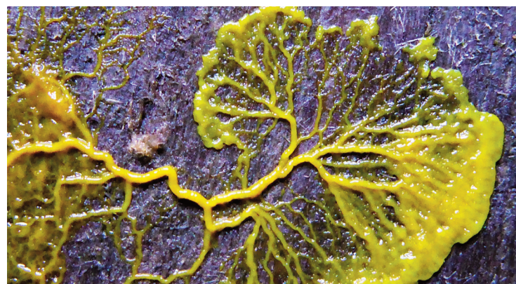
Physarum polycephalum appelé "blob"

Inscription recommandée au 04 71 78 14 36 ou biblioth.riom.mgnes@wanadoo.fr Passe sanitaire demandé.