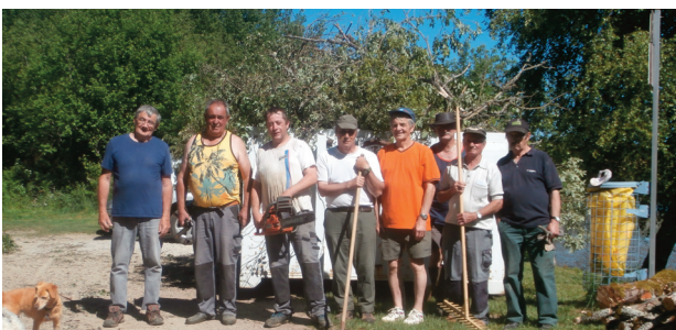
Opération de nettoyage à Majonenc juin 2021