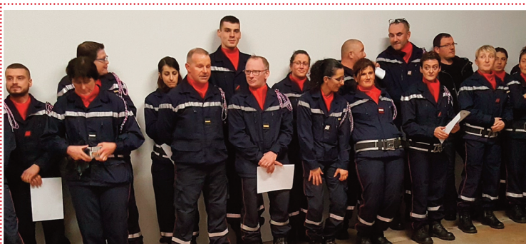
Rejoignez le centre de secours de Riom-ès-Montagnes

Le Centre d'incendie et de secours de Riom-ès-Montagnes compte 27 sapeurs-pompiers et recherche de nouveaux volontaires pour venir grossir les rangs de la caserne.