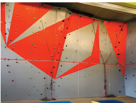
Le nouveau mur fin prêt

La reprise des entraînements en escalade pour les nouveaux adhérents, les enfants sous la responsabilité des parents et adultes débutants se fera lundi 4 octobre à 18