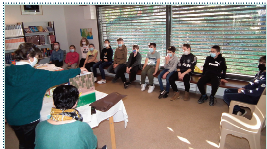
Présentation des albums aux élèves de 6 ème à la Bibliothèque