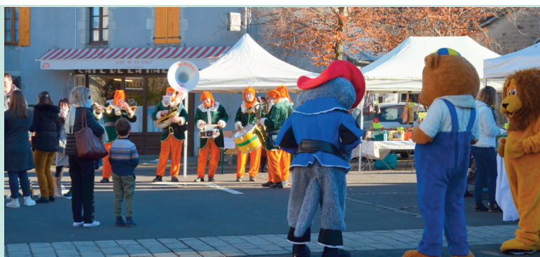
Mascottes et Banda ont divertis les visiteurs

Le 19 décembre dernier la place de la Halle accueillait le marché de Noël. Ce rendez-vous convivial organisé par l’Association des Commerçants et Artisans Riomois revenait après une année d’interruption en 2020.