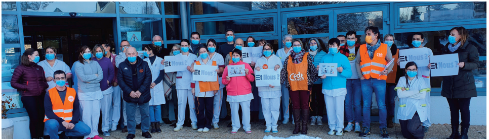
Manifestation au centre G. Champsaur AFSEP

"Et nous ?" s'indignait le personnel du centre Geneviève Champsaur AFSEP le 30 novembre dernier en découvrant que nombre d'entre eux ne bénéficieront pas de la prime Segur de 183 € net / mois.