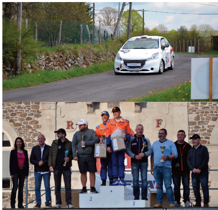
Le podium s'est déroulé sur le parvis de la mairie, en présence des élus.