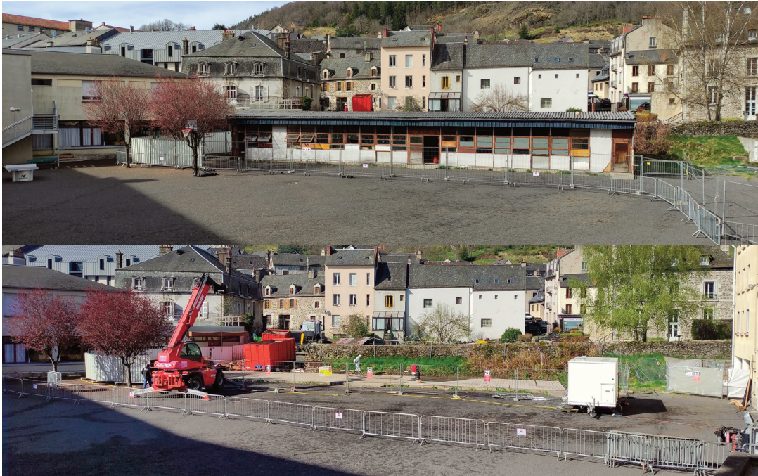
Avant/Après : la destruction du préfabriqué dans la cour du collège.

Des travaux sont en cours pour avoir accès à l'aile inoccupée du collège Georges Bataille, dans le but futur de réhabiliter le bâtiment et de lui donner une nouvelle vocation.