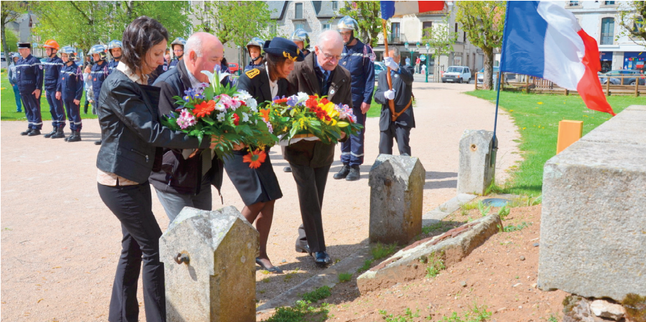
Une gerbe sera déposée au monument aux morts.

La cérémonie de commémoration de l'Armistice de 1945, marquant la fin des combats de la seconde guerre mondiale, sera commémorée dimanche 8 mai. Au programme : À 9h45 : rassemblement devant la mairie. 10 heures : défilé et dépôt de gerbe au monument aux morts. Un vin d'honneur sera offert à l'issue de la cérémonie, dans la salle du sous-sol de la mairie.