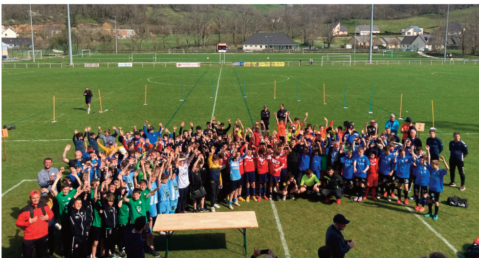
Seize équipes venues de tout le département se sont affrontées.

Samedi 16 avril dernier au stade du Pré-Bijou se tenaient les finales départementales de football U12-U13.