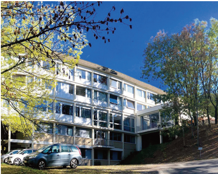
La clinique a du mal à recruter.

La clinique du Haut Cantal fait actuellement face à des difficultés de recrutement, notamment de médecins, qui pourraient, à terme, mettre en péril la prise en charge des patients.