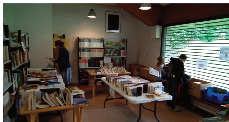
La braderie a attiré les petits comme les grands.