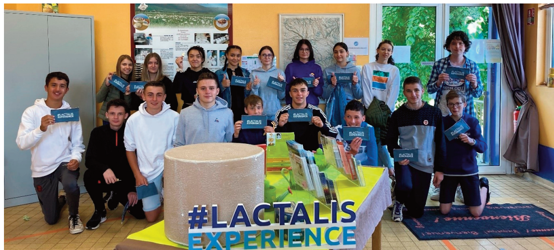
Les élèves ont pu découvrir les métiers de l'agroalimentaire et les formations adaptées à ceux-ci.

Ensuite, les élèves ont pu visiter les différents ateliers de Riom et participer à une dégustation des fromages fabriqués par le site notamment d'Appellation d'Origine Protégée (Cantal,