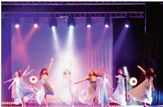
L'association R'Dance a fait son gala de fin d'année.