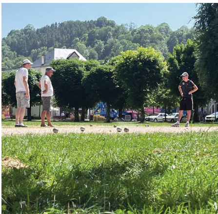
Le concours de pétanque a connu un beau succès.

Une fois le soir tombé et l'atmosphère redevenue plus respirable, le bal organisé sur le parking de la piscine a fait le plein, en faisant danser plus de 400 fêtards ! Le dimanche matin, ce ne sont pas moins de 51 petits-dé-