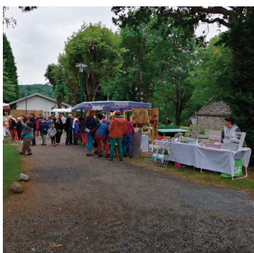
Les marchés nocturnes sont de retour (photo d'archives)

Le camping propose de nouveau cette année ses marchés nocturnes. Rendez-vous tous les vendredis dès le 15 juillet pour profiter de la vingtaine de stands présents sur place.