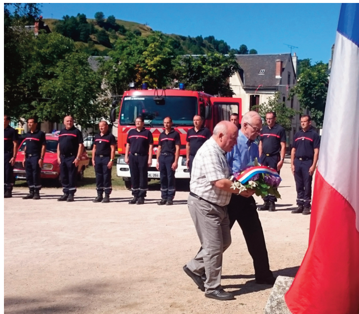
La cérémonie du 14 juillet se déroulera à 11 h, place du Monument.

Depuis maintenant 5 ans, l'amicale des sapeurs-pompiers organise le 14 juillet avec l'Office municipal des animations et des fêtes. Cette année, la cérémonie débutera à 11 heures sur la place du monument, en présence des élus. Puis, une exposition de véhicules des pompiers se déroulera sur toute la journée. Le public pourra voir les six plus an-