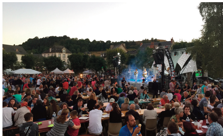
Les marchés de pays reviennent chaque lundi de l'été.

cuterie, saucisse/aligot, truffade et côte de porc de la famille Valmier, burgers Salers de Pissavy, Saint-Nectaire fermier, glaces Richard, fromages de chèvre, bourriols, salades