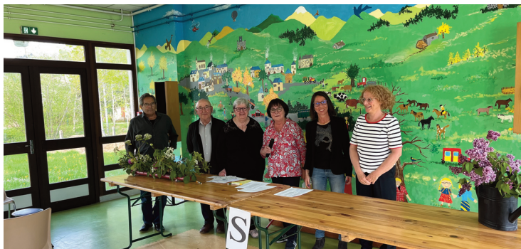
Le club de bridge du Haut Cantal a organisé son traditionnel tournoi du 8 mai.

Le club de bridge a organisé son tournoi du 8 mai à l'école Georges Pompidou. Un événement qui a connu une belle affluence avec des joueurs venus de toute la région.