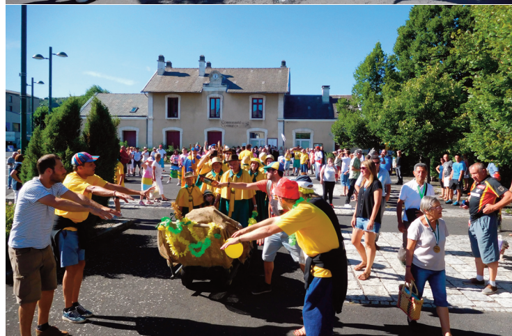
Spectacles et déambulations seront au programme (photo d'archives).