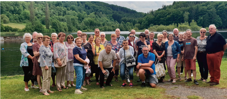
Charentais comme Auvergnats, tous ont été ravis de se retrouver, après 3 ans d'absence.

Durant 3 jours, les 4, 5 et 6 juin dernier, le comité de jumelage de Riom-ès-Montagnes a reçu une délégation de l'île d'Aix-Fouras, après trois ans sans se rencontrer.