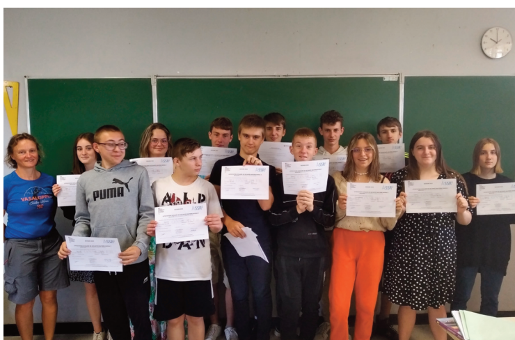
Les élèves ont reçu leur diplôme.

Le groupe scolaire du Sacré Coeur a remis le 16 juin dernier, les diplômes de PSC1 (Prévention et secours civiques de niveau 1) et d'ASSR2 (Attestation scolaire de sécurité routière) à ses élèves de 3ème. Tous les élèves ont été reçus ! Deux d'entre eux étaient déjà en posses-