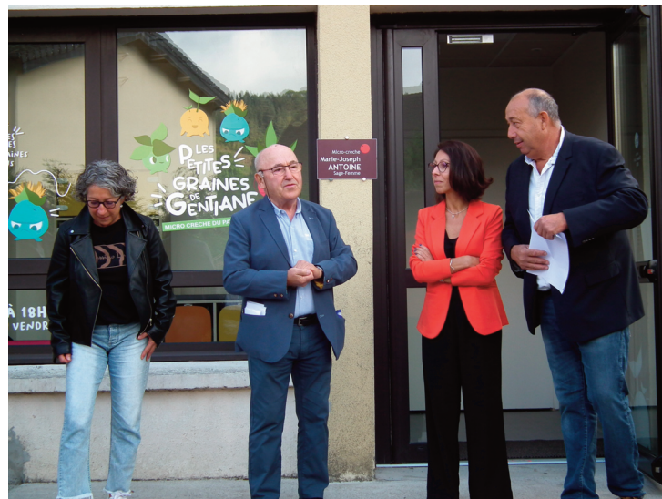
L'inauguration a eu lieu vendredi 16 septembre.

Pour rappel, ces travaux ont débuté en octobre 2021, après un gros travail d'études, mené par la communauté de communes du Pays Gentiane. Celle-ci a fait ressortir un grand besoin de