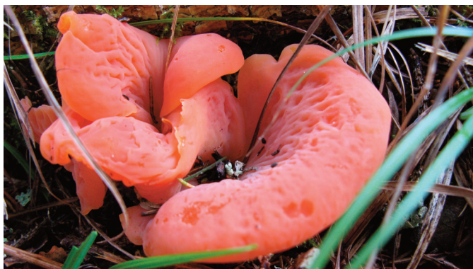
Des sorties sur le terrain seront organisées.

Le projet principal des JMHA est axé sur l'amélioration de la connaissance de la biodiversité s'agissant des champignons et les lichens, via la réalisation d'inventaire dans les différents types de milieux naturels de la Haute Auvergne, avec en toile de fond