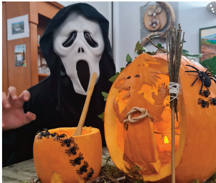
Tous les participants seront récompensés avec des friandises !

L'Office municipal des animations et des fêtes (OMAF), organise cette année encore Halloween et son traditionnel concours de citrouilles, lundi 31 octobre ! À partir de 15h30, les participants pourront déposer leur citrouille creusée et décorée au parc à jeux, place du Monument, (ou à la Halle en cas de pluie). Les citrouilles seront soumises au vote et la remise des prix se déroulera à 18h30. Les gagnants et plus largement tous les participants seront récompensés avec des friandises ! Au programme également de cette après-midi : distribution de bonbons, parc hanté mais aussi tatouages et photos ! Et bien sûr, le déguisement est obligatoire ! (Règlement du concours sur la page Facebook de l'OMAF).