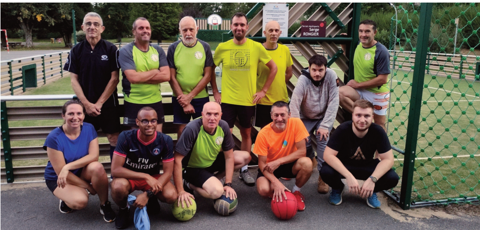
Le Gentiane Multisports, ce sont six sports pratiqués en alternance.

C'est une nouvelle saison qui démarre au Gentiane Multisports. Les séances ont repris le 15 septembre, au city park dans un premier temps, avant de retrouver le gymnase rénové.