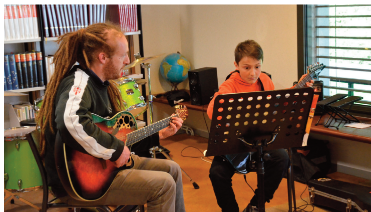
Les cours ont repris (photo d'archives).

Des professeurs diplômés enseignent le piano, la guitare classique et électrique, le violon, le violoncelle, la trompette, le trombone, la flûte traversière, le saxophone, la batterie et le chant. Il est également possible sur demande importante d'ouvrir une classe à d'autres instruments sous ré-