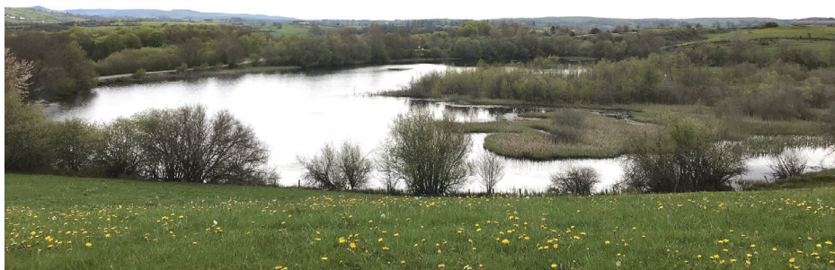
Une boucle de 7 km jusqu'au lac des Bondes attend les participants.

La section trail organisera vendredi 18 au 19 novembre prochain, une course pédestre, sur 24h. Un challenge sportif, en solo ou en équipe, au profit de l'association ASM SOS.