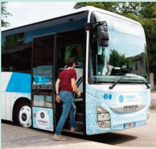
Des bus supplémentaires sont mis en place.

Pour les étudiants rimois qui souhaitent rentrer à Riom-ès-Montagnes pour le week-end, l'inverse est également possible. Au départ de Clermont, le vendredi, un bus a été ajouté à 14h10 pour une arrivée à 16h à Riom, qui vient en complément de celui de 18h35 (arrivée à 20h30). Le dimanche soir, il leur sera ensuite possible de partir de Riom à 16h15 et d'être à Clermont à 18h15 !