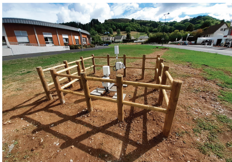
La station a été implantée proche du centre NAFSEP.

Dans un premier temps, un pluviomètre non réchauffé (qui n'a pas besoin d'électricité) a été installé, avant d'implanter le pluviomètre réchauffé, une fois que l'électricité sera présente. Un raccordement qui devrait être fait à la