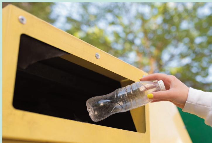
Désormais, tous les emballages, même plastiques, seront à recycler. (Photo d'illustration)

C'est une modification qui va considérablement changer la vie des habitants du territoire. Depuis le début du mois, une nouvelle organisation de la gestion des déchets, engagée par le Sytec de Saint-Flour sur les trois communautés de communes de son territoire, dont Pays Gentiane, a considérablement fait évoluer les consignes de tri. Celles-ci seront désormais plus simples ! Dorénavant, il ne sera plus nécessaire de se poser de questions : tous les emballages, y compris plastiques, seront à