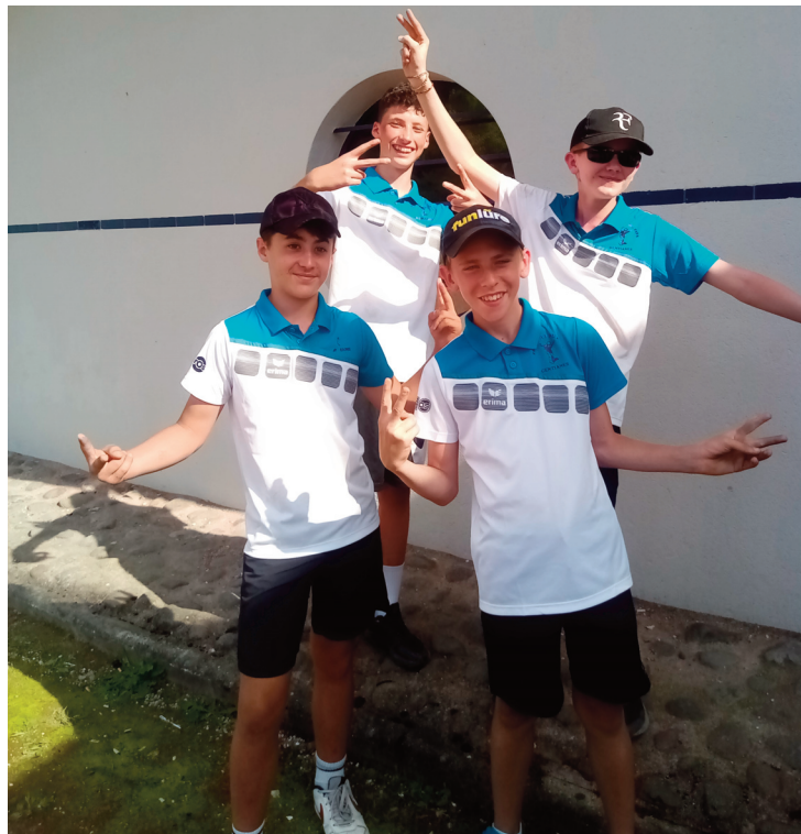
Les jeunes du club de pétanque du Pays Gentiane enchaînent les compétitions.