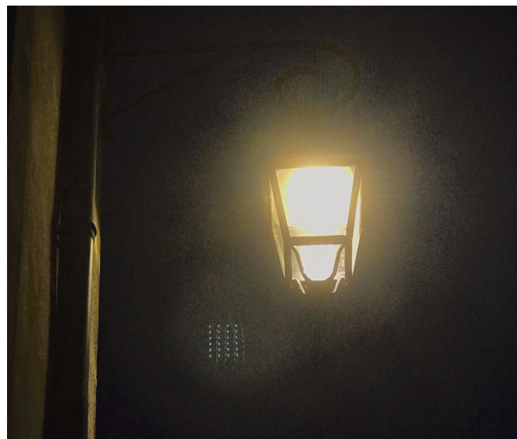
Désormais, l'éclairage public s'éteint à 23 heures et se rallume à 6 heures.

L'ensemble des élus s'est d'abord prononcé, à l'unanimité, pour une extinction de l'éclairage public de 23 heures à 6 heures du matin