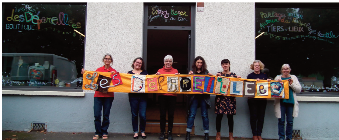
Chacun peut venir faire vivre le tiers lieu avec ses savoirs et s'initier aux techniques de recyclage.

La ressourcerie d'Antignac vient d'ouvrir Les Dépareillées, à Riom-ès-Montagnes, au 15 rue du lieutenant Basset. Un tiers lieu, qui propose des ateliers de recyclage de vêtements, faisant également office de friperie.