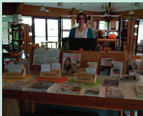
La grainothèque s'est affinée, et attend vos graines !