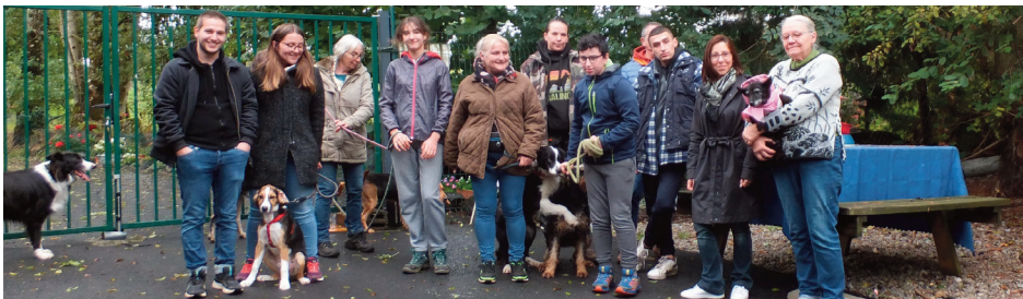
Les portes ouvertes ont été l'occasion de découvrir les pensionnaires du refuge.

Le public a pu découvrir le Refuge Bienvenue et ses pensionnaires lors de deux journées portes ouvertes. Une occasion pour l'équipe de créer des coups de cœur, en vue de futures adoptions.