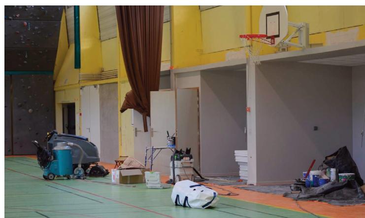
En travaux depuis plusieurs mois, le gymnase a rouvert ses portes le 17 octobre dernier.

Depuis le mois de janvier, la commune a en effet entrepris des travaux de mise en accessibilité du bâtiment, mais aussi d'économies d'énergie. L'ensemble des menuiseries ont été changées, et les vestiaires ont pu prendre un sacré coup de neuf, avec notamment une nouvelle isolation. Ceux-ci ont également été réaménagés et