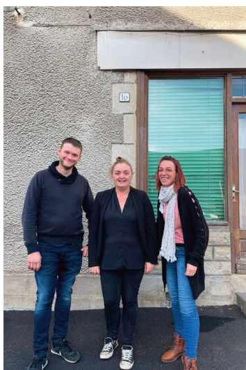
Le nouveau bureau de l'Amicale.

Après plusieurs années de bons et loyaux services, certains membres ont pris la décision de quitter l'asso-