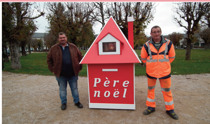
Sur le Coudert, la boîte à lettres du père Noël sera installée. (Photo d'archives)

Comme l'année précédente, la boîte à lettres du Père Noël sera installée sur le Coudert, dans le courant du mois de novembre. Les enfants qui souhaitent écrire au grand monsieur en rouge et blanc sont invités à le faire au plus tôt. En effet, ils ont jusqu'au 17 décembre pour glisser leur lettre dans la boîte. Chaque lettre envoyée avant cette date sera sûre d'avoir une réponse !