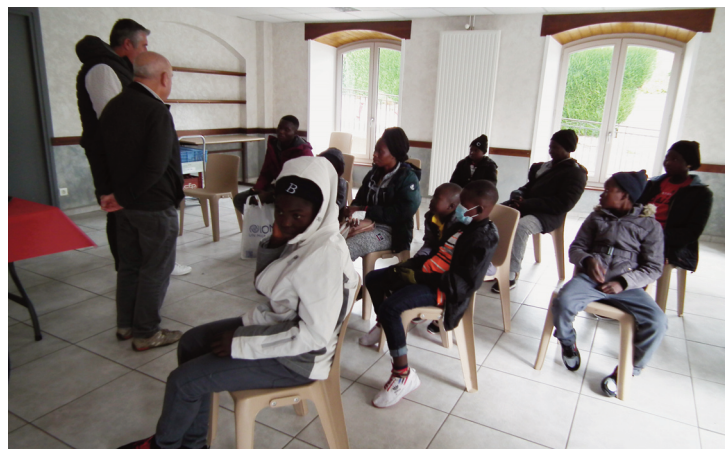
8 enfants et 3 adultes sont arrivés jeudi 27 octobre dernier.

Jeudi 27 octobre, après un long voyage depuis le Tchad jusqu'à Paris, puis Clermont-Ferrand, un groupe de 11 réfugiés centrafricains est arrivé à Riom-ès-Montagnes, accompagnés du personnel de l'association Aurore, qui les prend en charge. Issus d'une même famille, ils ont été répartis dans plusieurs logements différents, mis à disposition par Cantal Habitat, et pris en charge par l'Etat. Ce sont ainsi 8 enfants et 3 adultes qui ont été reçus en mairie dès leur arrivée,