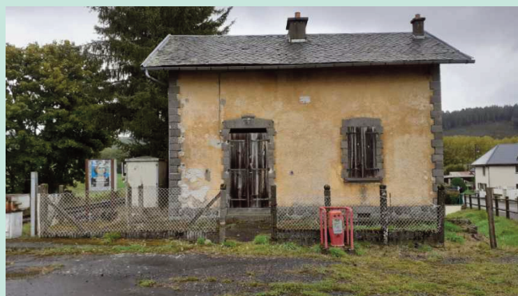
Les élus vont étudier la faisabilité du projet de restauration de la maisonnette du garde barrière.

Suite à la création de la nouvelle Ecole de musique du Haut Cantal, le conseil municipal a approuvé une modification de subvention, au titre de l'Exercice 2022, comme suit : Ecole de musique la Fraternelle : 13 666 € (8 mois d'exercice) ; Ecole de musique du Haut Cantal : 6 834 € (4 mois d'exercice).