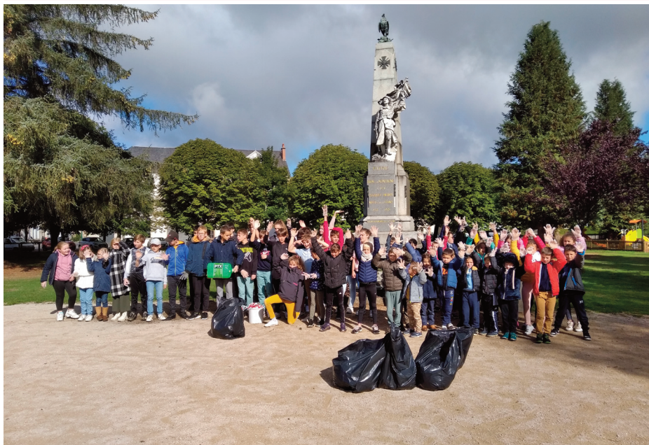
Les élèves ont ramassé 20 kg de déchets.