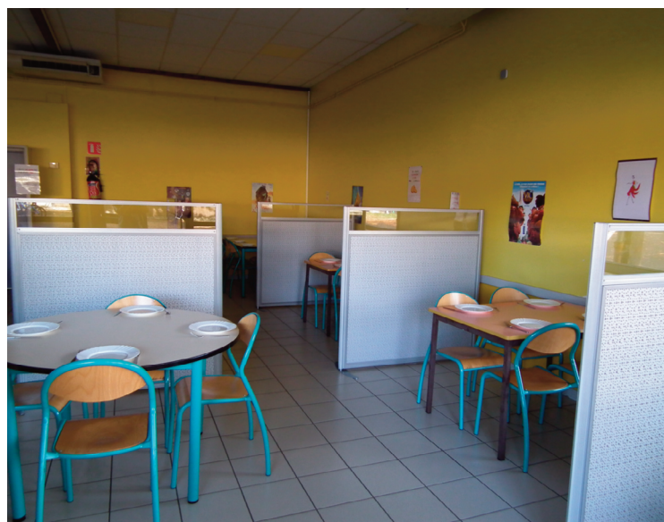
Des claustras, pour diminuer l'effet de bruit, ont été installés à la cantine.

La municipalité informe les familles que l'entreprise Les Halles SOLANID, prestataire pour la préparation et la fourniture des repas de la cantine scolaire, a procédé à l'ajustement des prix des repas depuis le 1er septembre. Cet ajustement se traduit par une hausse des tarifs de l'ordre de 20 centimes par repas. Mais au vu du contexte économique actuel, les élus de Riom-ès-Montagnes, réunis en conseil municipal le 6 octobre dernier, ont décidé que la commune prendrait à sa charge la différence du prix des repas cette année scolaire, pour ainsi éviter un surcoût aux familles. Cette augmentation est estimée, sur une base de 120 enfants par jour à la cantine, à environ 3 500 € par an, sup-