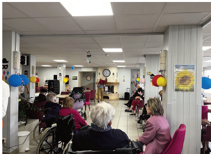
Les Tournesols organisent des spectacles, goûters, sorties, pour les résidents de l'Ehpad.

L'année 2024 est déjà bien entamée et de nombreux événements ont été lancés : bal de début d'année, tirage des rois, fête de l'amour, quine, bal