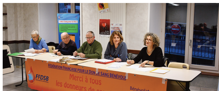
L'association des Donneurs de sang a tenu son assemblée générale.

Les chiffres de l'année 2023 ont été présentés et sont en légère baisse avec 298 donneurs (contre 340 en 2022) soit 277 poches recueillies (310 en 2022). Une bonne nouvelle cependant : le nombre de nouveaux donneurs est, lui, en augmentation, avec 49 nouveaux donneurs, contre 35 en 2022. L'objectif est donc de fidéliser ces nouveaux donneurs et