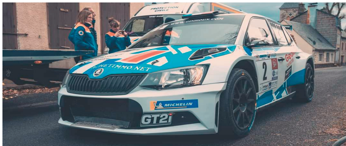
Les pilotes de l'association ont participé à plusieurs événements régionaux, nationaux voire internationaux.

Du côté du rapport moral, le nombre des licences reste stable en 2023, avec 51 licenciés (44 hommes contre 7 femmes), dont 18 licences encadrements. Par ailleurs, l'association se félicite d'une grande représentation