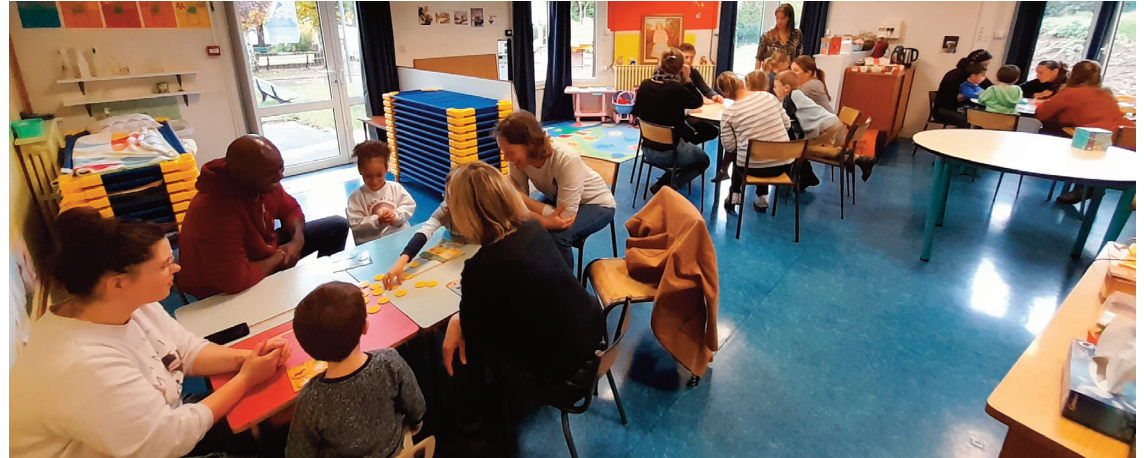
Tous les quinze jours, l'école invite les parents des maternelles à venir jouer avec leurs enfants.

Le principe : tous les quinze jours, en début de matinée, les parents