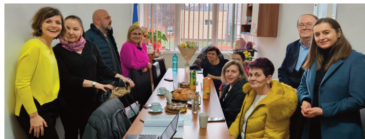
Une délégation du collège de Riom s'est rendue en Roumanie, où partiront les 6e en mai.

Lors de ce déplacement, plusieurs établissements scolaires ont ouvert leur porte à la délégation française,