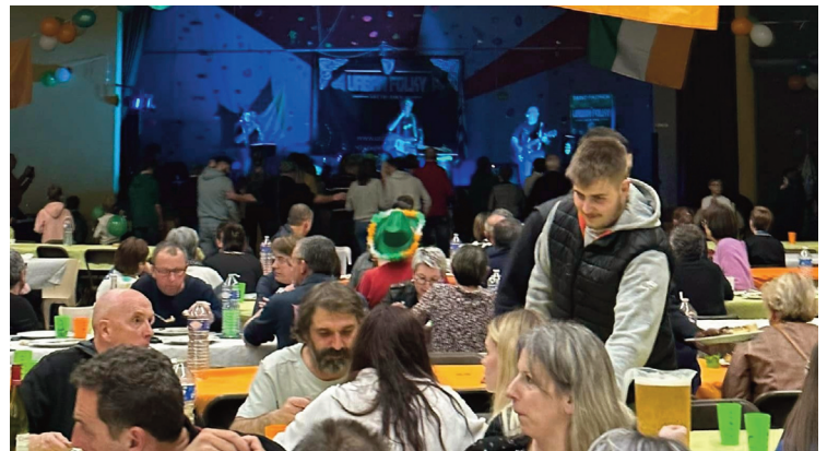
Comme l'an dernier, un repas et une soirée dansante seront organisés.

L'Amicale Laïque du groupe scolaire Georges Pompidou organise cette année encore la Saint-Patrick samedi 16 mars prochain au gymnase municipal à partir de 19 heures. Au programme : un repas avec boeuf à la bière, purée de pommes de terre, fromages, tarte aux pommes et café (20 €), ou un menu enfant avec nuggets, frites et tarte aux pommes (10 €).