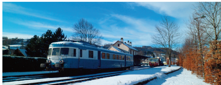
Le train a bien débuté les vacances d'hiver avec quatre circulations.