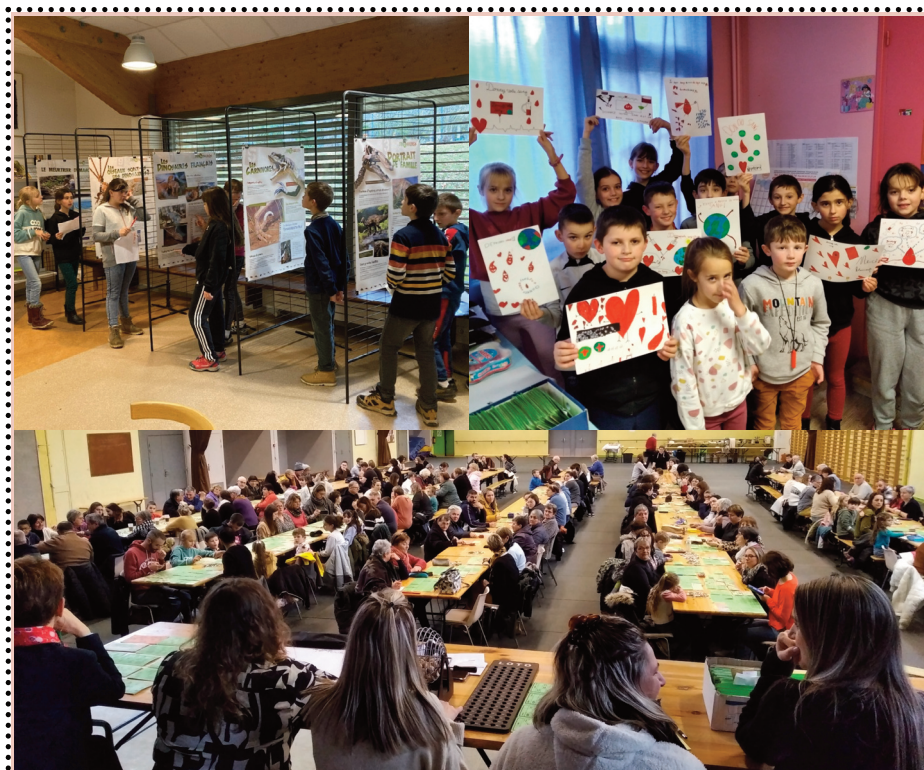
Exposition, concours de dessins, quine... Le programme était chargé à l'école du Sacré-Coeur.