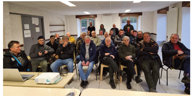
Les pêcheurs ont tenu leur assemblée générale.

Le bilan fait apparaître une progression de 71 cartes de pêche, soit 561 pêcheurs. Le président en a profité pour informer que cette année, la région rembourse la carte de