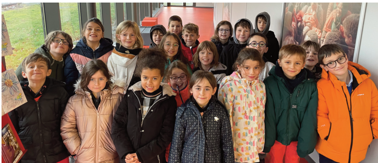
Les élèves ont pu assister à des projections de films, travaillés en classe.

Les enseignants des classes de Grandes sections, CE1, CE2 et CM1 de l'école Georges Pompidou sont inscrits au projet Ecole et Cinéma, dans le cadre du parcours "Ma classe au cinéma". Ce programme propose aux élèves de découvrir des œuvres cinématographiques lors de projections organisées spécialement à leur intention dans les salles de cinéma et de se constituer ainsi, grâce au travail pédagogique d'accompagnement conduit par les enseignants, les bases d'une culture cinématographique. Ces séances sont accompa-