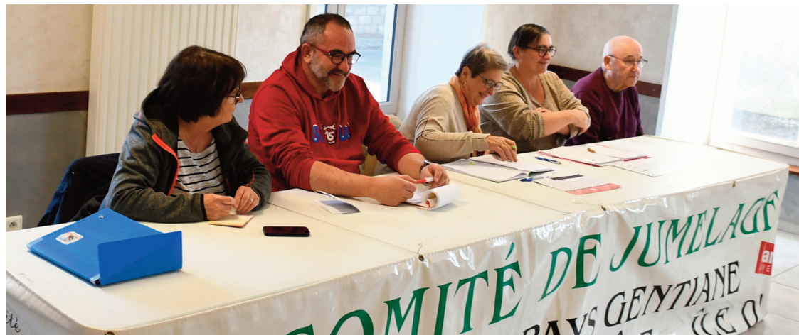
Les membres du comité de jumelage ont tenu leur assemblée générale.

En préambule, celle-ci annonce la fin du partenariat entre le comité et la Communauté de communes du Pays Gentiane. Par conséquent, la présidente précise que l'association s'est rapprochée de la mairie de Riom afin de créer un comité de jumelage entre les deux seules villes de Riom et de Fouras, renommant ainsi le comité, "Comité de jumelage de Riom-ès-Montagnes" (contre "Comité de jumelage du Pays Gentiane"), après approbation par le conseil municipal. Les membres ont ensuite pu dresser