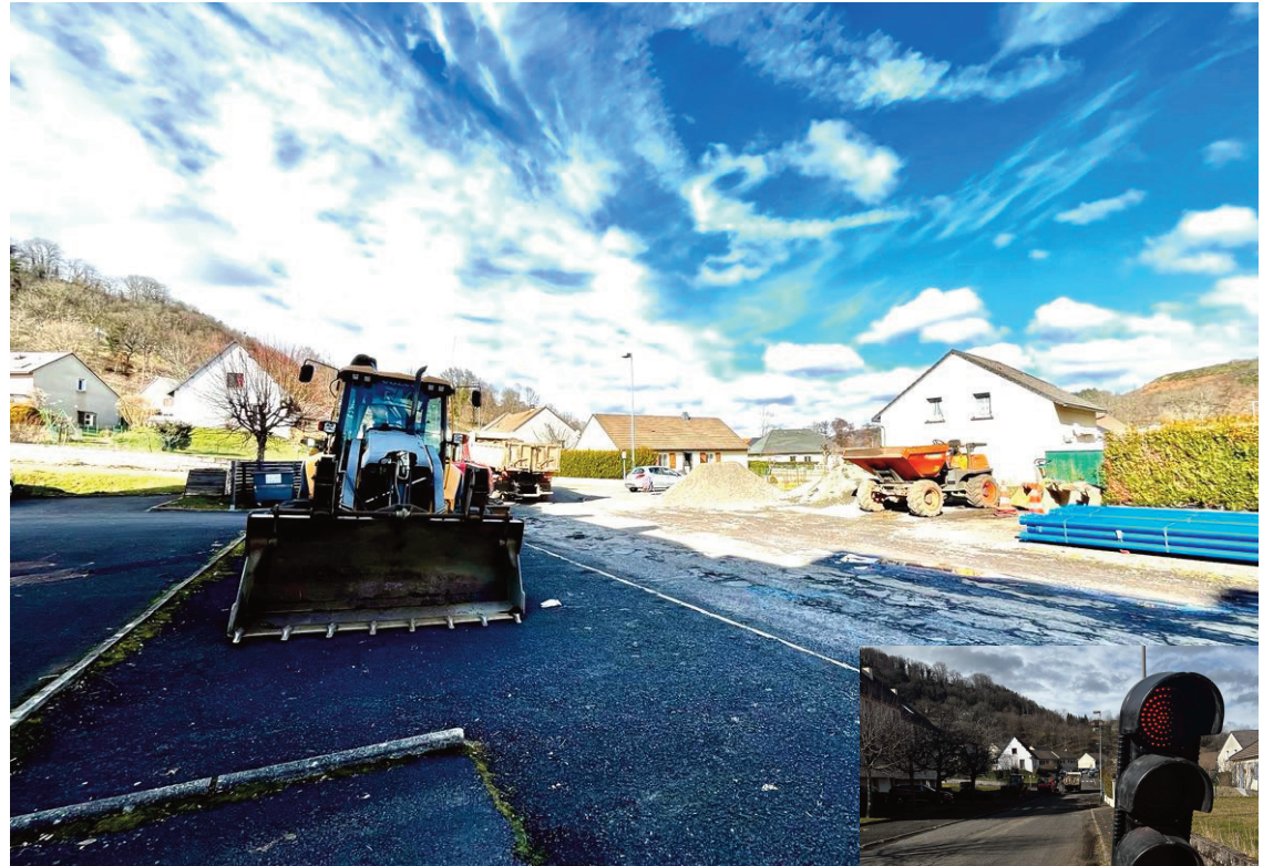
Le secteur de la rue du Bois de la Tourne est en travaux pour plusieurs mois.

Le chantier a été confié à l'entreprise Cymaro, et représente un investissement de 364 900 € HT, et 15 000 €